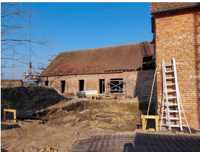
Vooranzicht schuur = gemeenschappelijke ruimte

Een ploeg van ongeveer 15 personen werkt hier dagelijks aan de verwezenlijking van onze droom!